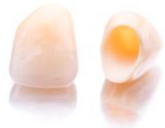
Ästhetische Kronen aus reiner Keramik

Wenn Sie noch andere Metalle im Mund haben (z.B. Amalgam, herausnehmbaren