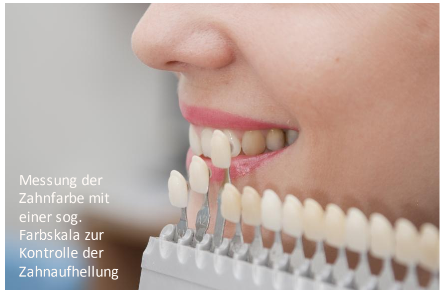
Messung der Zahnfarbe mit einer sog. Farbskala zur Kontrolle der Zahnaufhellung

Wer seine Zähne aufhellen lassen will, steht vor der Wahl: Selber machen mit Mitteln aus dem Internet oder aus dem Drogeriemarkt? Oder doch lieber vom Zahnarzt, weil man sich da besser aufgehoben fühlt?