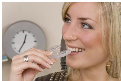
Invisalign: Kieferorthopädische Regulierung mit durchsichtigen Kunststoff-Folien

ante ist die sogenannte Invisalign-Technik. Das sind durchsichtige Kunststoff-Folien, die Sie selbst bei Bedarf in den Mund einsetzen. Sie sind so gestaltet, dass sie die Zähne nach und nach sanft regulieren.