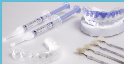
Home-Bleaching-Set: Bleaching-Gel (links oben) und Trägerfolie (links unten), die mit dem Bleaching-Gel über die Zähne gestülpt wird. Rechts oben das Gipsmodell, auf dem die Trägerfolie hergestellt wurde.

Beim Home-Bleaching hellen Sie Ihre Zähne zu Hause auf. Die dafür notwendigen Hilfsmittel erhalten Sie vom Zahnarzt. Er kontrolliert vorab, ob Ihre Zähne für das Bleichen geeignet sind und lässt