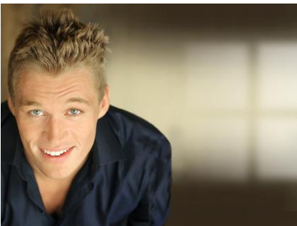
Zähne können jederzeit einfach und schnell wieder nachgehellt werden.

Ist das Nachdunkeln ein Problem? Eigentlich nicht! Die Zähne können jederzeit wieder nachgehellt werden. Das geht viel schneller als bei der ersten Aufhellung und ist preisgünstiger.