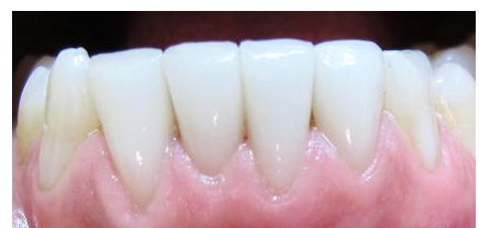
Veneers der unteren vier Schneidezähne (vor 4 Jahren eingesetzt): Das Zahnfleisch ist hell rosa und absolut gesund. Keine Verfärbung der Veneers.

Obwohl Veneers so grazil sind, halten sie sehr lange: Nach unserer Erfahrung 15 Jahre und länger! Veneers sind nicht nur für die Zähne schonend, sondern auch für das Zahnfleisch: Sie laufen zum Zahnfleischrand hin ganz dünn aus und reizen es daher nicht. Man sieht auch keinen Übergang vom Veneer zum Zahn.